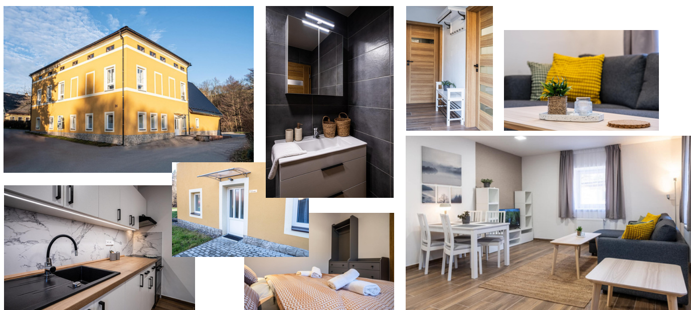
Obec Šonov

A v neposlední řadě děkujeme všem ostatním, kteří se na apartmánu jakkoli podíleli. Bez vaší pomoci by to nebylo možné! Těšíme se na vaši návštěvu!